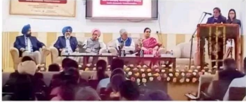
सैमीनार में मौजूद मेहमान व आयोजक।