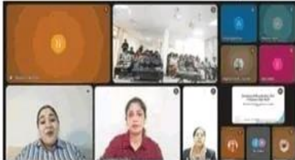
ਓਪਨ ਯੂਨੀਵਰਸਿਟੀ ਵੱਲੋਂ ਆਯੋਜਿਤ ਸੈਮੀਨਾਰ ਦਾ ਦ੍ਰਿਸ਼।