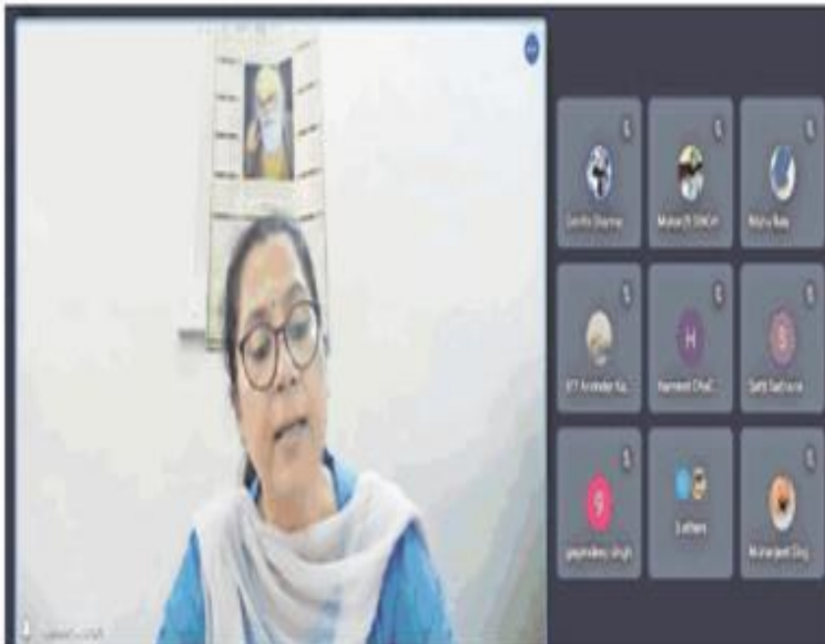
ਯੂਨੀਵਰਸਿਟੀ ਵੱਲੋਂ ਆਯੋਜਿਤ ਪਰਸਨਲ ਕਾਂਟੈਕਟ ਪ੍ਰੋਗਰਾਮ ਦਾ ਦ੍ਰਿਸ਼।